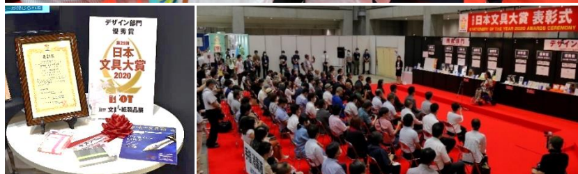
<出展製品と会場の様子>